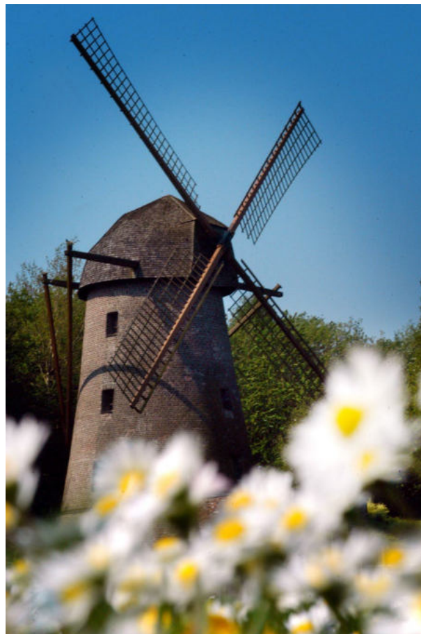
Turmwindmühle Rheurdt